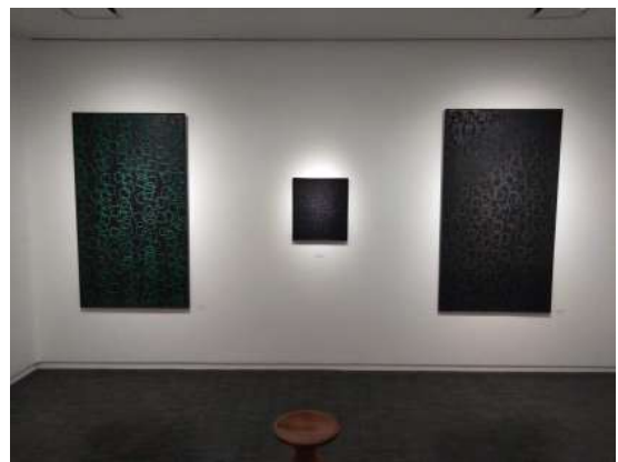
2F 黒の部屋 (四角の輪模様も)