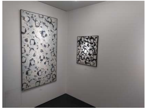
1F 黒灰の四角の輪模様