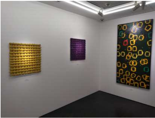
1F 格子 (左) と四角の輪模様 (右)

「上前智祐展」展示風景 (2019年7月26日～8月31日、銀座ホワイトストーンギャラリー)