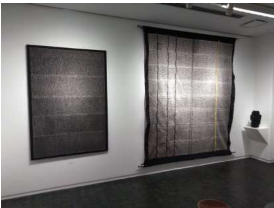
2F 黒の部屋 (縫いとオブジェ)